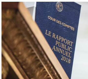
Le jugement de la Cour des comptes

La Cour des comptes a estimé que le compteur "Linky" tel qu'actuellement déployé était « Un dispositif coûteux pour le consommateur mais avantageux pour ENEDIS » (Rapport annuel 2018, Tome I, p. 253)