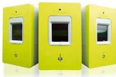
La mise en demeure de la CNIL

La Cour des comptes a estimé que le compteur "Linky" tel qu'actuellement déployé était « Un dispositif coûteux pour le consommateur mais avantageux pour ENEDIS » (Rapport annuel 2018, Tome I, p. 253)